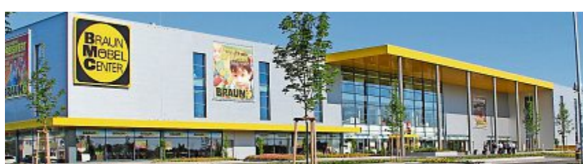
BRAUN Möbel-Center freut sich über viele Besucher und eine erfolgreiche Hausmesse.

Auch in diesem Jahr findet eine Küchenhausmesse bei BRAUN Möbel-Center statt. Über acht Tage werden zahlreiche Aktionen und Vorführungen geboten. Besonderes Highlight der Messetage sind die 10 Prozent Messerabbatt, die für Küchen, Bäder und Elektrogeräte während der Küchenhausmesse gewährt werden.