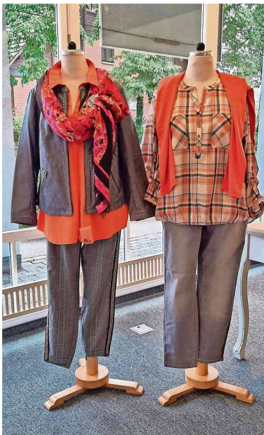
Kräftige Farben sind auch dieses Jahr wieder im Trend.

Weitere Informationen: Molli Mode Fachgeschäft Damaris Keller Thurstrasse 14, 8500 Frauenfeld www.mollimode.ch